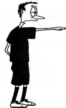
Zeichen Einschlag, Freischlag